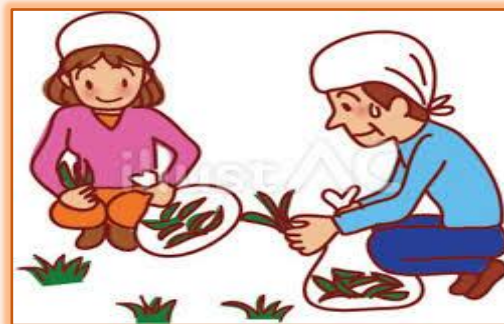
庭の草取り・手入れ