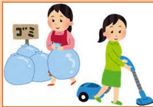
ゴミ出し・室内の掃除